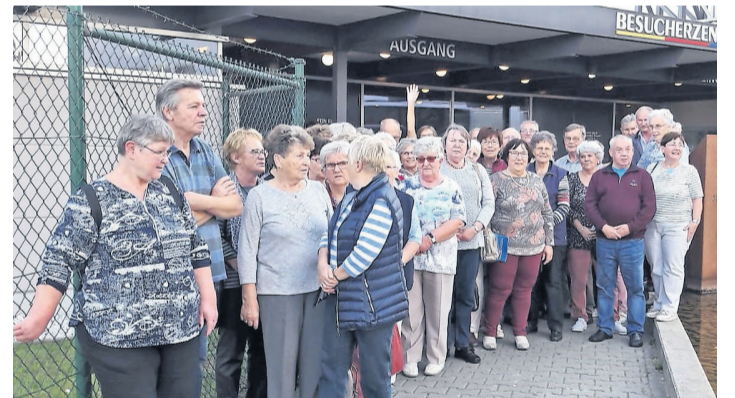
Die Mitglieder der Volkssolidarität Ludwigslust OG 07 auf ihrer Herbstreise 2018.

Zarrentin (hn) – Am 4. November öffnet um 10 Uhr der Biosphäre-Schaalsee-Markt am Informationszentrum Pahlhuus in Zarrentin, Wittenburger Chaussee 13 in 19246 Zarrentin am Schaalsee. Der Markt bietet Produkte aus der Region, Gesundheitsvortrag und Unterhaltung (10 bis 17 Uhr). Veranstalter ist der Förderverein Biosphäre Schaalsee e.V. in Kooperation mit dem Biosphärenreservatsamt Schaalsee-Elbe. Infos 03885132136, www.biosphaere-schaalsee.de.