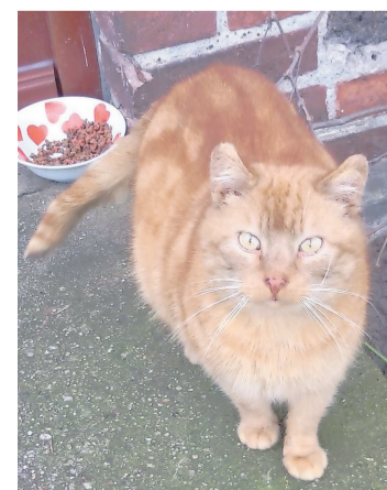
Rubio ist ein lieber Fundkater, der ein oder sein eigenes Zuhause sucht.

Brunow (hn) - Rubio, ein sehr hübscher roter Kater, bisher noch nicht kastriert, hat sich vor einigen Monaten als Fundkater in der Tierpension Mecklenburg in Brunow eingefunden und genießt die Zuwendung und das leckere Futter. Nach seiner anfänglichen Schüchternheit ist er toll zutraulich geworden. Rubio ist sehr verfressen und hat eine alte Verletzung des Schwanzes. Er ist auf der Suche nach einem schönen ländlichen Zuhause mit Freigang oder vielleicht wird er ja auch irgendwo vermisst. Weitere Infos in der Tierpension unter Telefon 038721-228177.