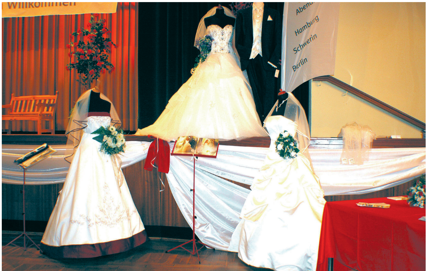
Festkleider für Ihren schönsten Tag im Leben.

Parchim (hn) - Im Bürgerbüro der Stadt Parchim (u. a. Melde-, Pass- und Personalausweisangelegenheiten) gelten ab dem 1. März 2018 neue Öffnungszeiten. Hintergrund ist eine im vergangenen Jahr erfolgte Erhebung, die im zuständigen Fachbereich entsprechend ausgewertet worden ist. In Folge dessen wurden die neuen Öffnungszeiten dem tatsächlichen Bedarf der Bürgerinnen und Bürger angepasst. Öffnungszeiten bisher und noch bis zum 28. Februar 2018 / ab 1. März 2018 gültig: Montag: 9 bis 12 Uhr / Montag: 9 bis 12 Uhr Dienstag: 9 bis 18 Uhr / Dienstag: 9 bis 16.30 Uhr Mittwoch: 9 bis 12 / Mittwoch 9 bis 12 Uhr Donnerstag: 9 bis 18 Uhr / ab 1. März: Donnerstag: 9 bis 12 Uhr und 13.30 bis 18 Uhr Freitag: 9 bis 12 Uhr / Freitag: 9 bis 12 Uhr 1. Samstag im Monat: 9 bis 11 Uhr / 1. Samstag im Monat: 9 bis 11 Uhr Die aktuellen und neuen Öffnungszeiten finden Sie zudem auch auf der Startseite unserer stadteigenen Website unter www.parchim.de .